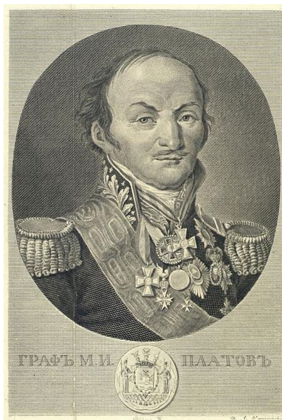
Рис. 2. Портрет графа Матвея Ивановича Платова, генерала от кавалерии, войскового атамана Донского Войска, с гербом на графское Российской империи достоинство. Гравер А.Г. Ухтомский. 1821 / Fig. 2. Portrait of Count Matvey Ivanovich Platov, General of cavalry, military ataman of the Don Army, with the coat of arms of the count's dignity of the Russian Empire. Engraver A.G. Ukhtomsky. 1821

В эпоху наполеоновских кампаний имя, дела и слава М.И. Платова были широко известны в России и Европе, но мирное время требовало решения новых задач – восстановления страны, проведения экономических и финансовых реформ, укрепления политической власти, других преобразований. Важное значение имела защита Российской империи и ее императора, русской армии, казаков и донского атамана от нападков и необъективной критики. Особенно в этом преуспевали английские и французские сатирики, с 1813 г. они публиковали и распространяли альбомы и отдельные сатирические листы в своих странах и за рубежом [12, 13].