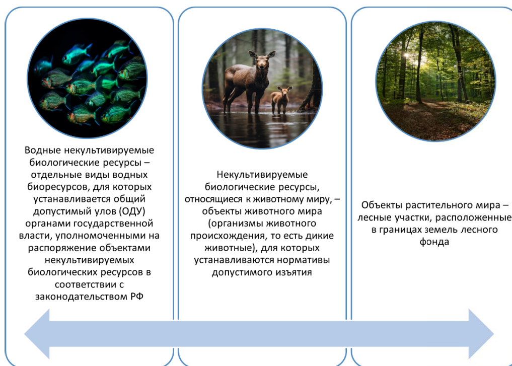
Рис 3. Определение состава инвентарного объекта некультивируемых биологических ресурсов / Fig. 3. Determination of the composition of the inventory object of uncultivated biological resources

Рассмотрим порядок определения видов некультивируемых биологических ресурсов в качестве инвентарного объекта (рис. 3).