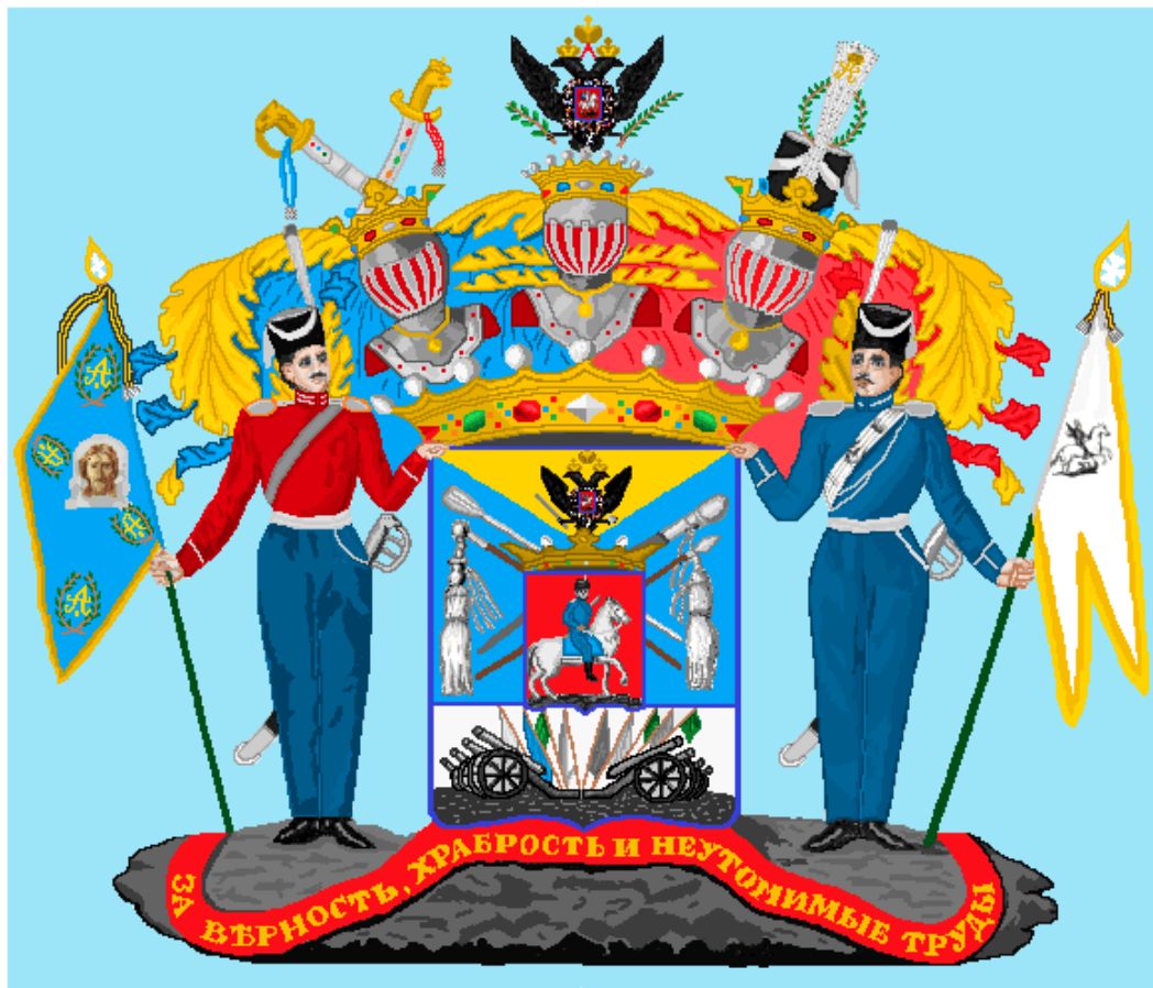
Рис. 1. Герб графа Матвея Ивановича Платова на графское Российской империи достоинство (цветная векторная версия А.И. Агафонова) / Fig. 1. The coat of arms of Count Matvey Ivanovich Platov on the dignity of a count of the Russian Empire (A.I. Agafonov's color vector version)

ния своего герба, получения диплома граф М.И. Платов. Наконец 15 марта 1816 г. император Александр I утвердил герб донского атамана (рис. 1). В ноябре 1816 г. он был доставлен со всем сопровождением (шкатулка, герб, грамота, кисти, печати и т. д.) гербообладателю.