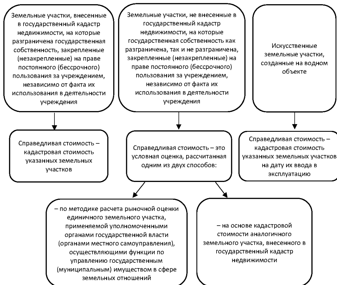
Рис. 2. Порядок определения справедливой первоначальной стоимости для земельных участков / Fig. 2. The procedure for determining the fair initial value of land plots

имости произведенных активов» отражаются доходы от реализации произведенных активов, операции по выбытию произведенных активов.